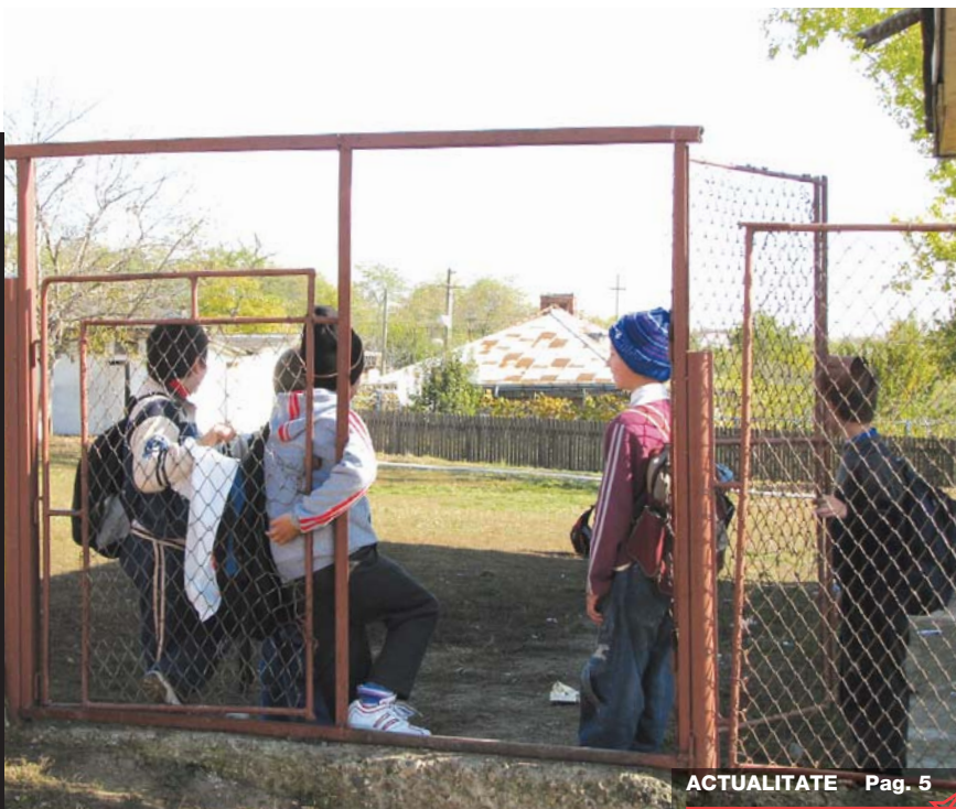
ACTUALITATE Pag. 5

♦ Iașul este amenințat de un genocid în masă ♦ Din cauza crizei economice, zeci de copii, cu vârste cuprinse între 0 și 2 ani, riscă să moară prin înfometare sau de frig ♦ Sărăcia a crescut alarmant numărul familiilor care își abandonează copiii ♦ Mai mult, cei abandonati de familii și internați în centrele speciale de plasament, care sunt paralizați, se nasc cu malformații congenitale, și care necesită o îngrijire permanentă, riscă să moară ♦ Statisticile sunt alarmante în județul Iași ♦ Conform datelor Direcției Generale de Asistență Socială și Protecția Copilului, un număr de 140 minori au intrat deja în centre de plasament, în regim de urgență, din cauza imposibilității părinților de a le asigura un trai, măcar la limita subsistenței