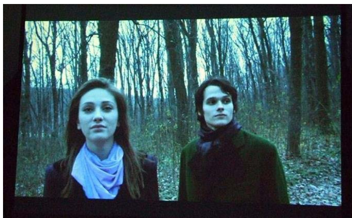
„George Enescu” Iași

Film realizat cu sprijinul Universității de Arte