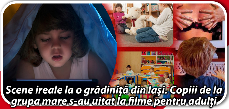
Scene ireale la o grădiniță din Iași. Copiii de la grupa mare s-au uitat la filme pentru adulți