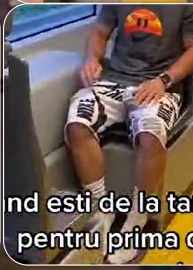
Cand esti de la tara si mergi pentru prima data cu tramvaiul