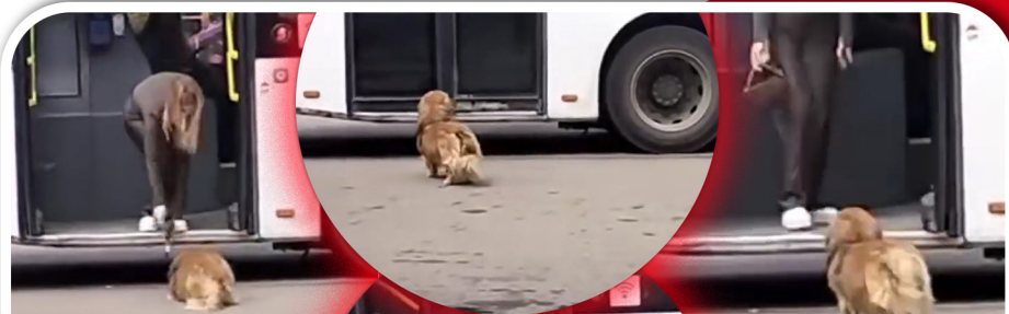
O divă blondă din Iași, care merge cu transportul în comun, și-a bătut câțelul cu poșeta peste cap