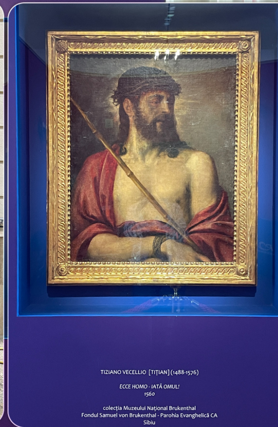
TIZIANO VECELLIO [TITIAN] (1488-1576)