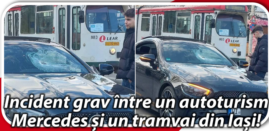
Incident grav între un autoturism Mercedes și un tramvai din Iași!