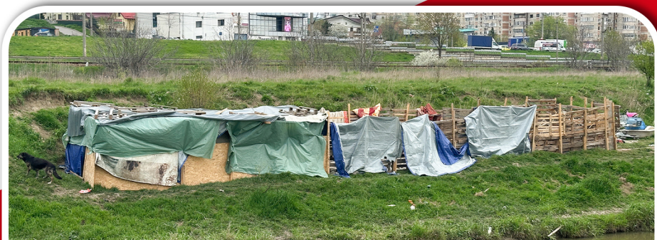
Padoc clandestin la marginea oraşului Iaşi! Peste 30 de câini sunt ţinuţi în condiţii improprii