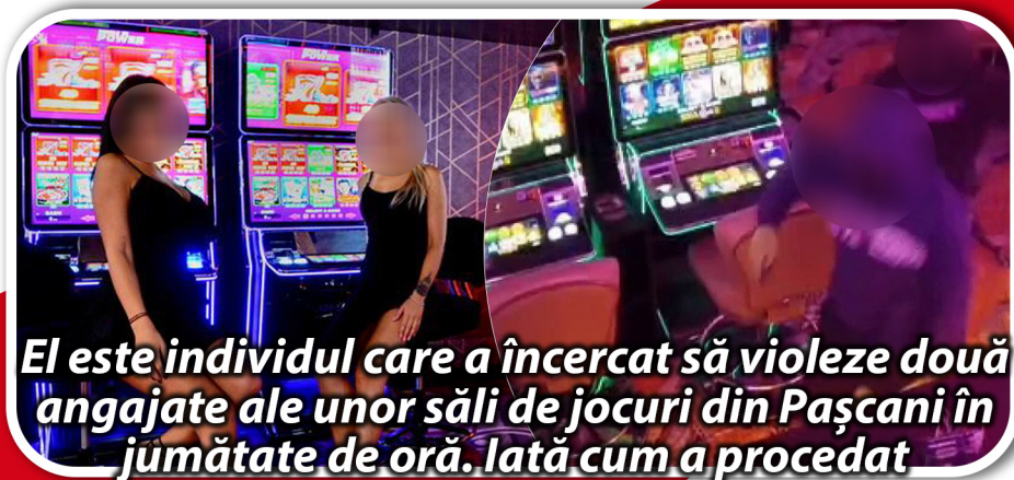
El este individul care a încercat să violeze două angajate ale unor săli de jocuri din Pașcani în jumătate de oră. Iată cum a procedat