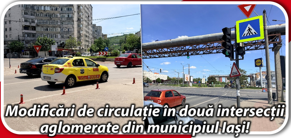
Modificări de circulație în două intersecții aglomerate din municipiul Iași!