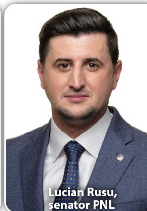
Lucian Rusu, senator PNL