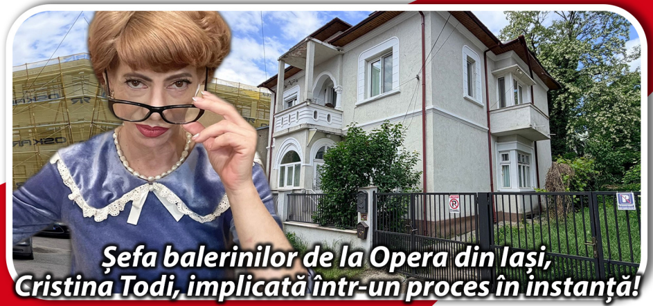
Șefa balerinilor de la Opera din Iași, Cristina Todi, implicată într-un proces în instanță!